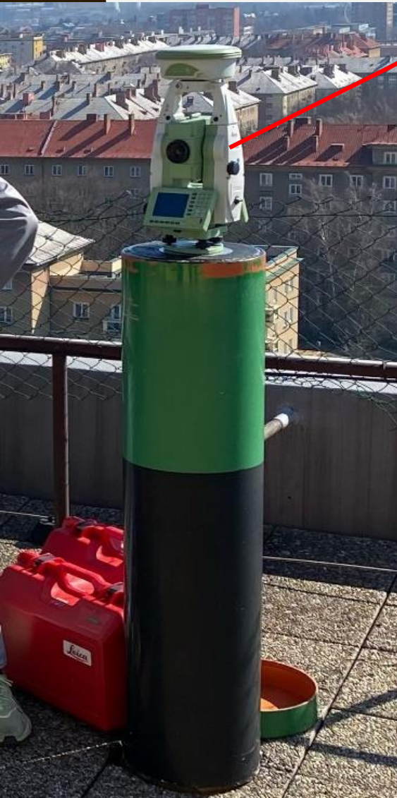
Multistanica Leica Nova MS 60