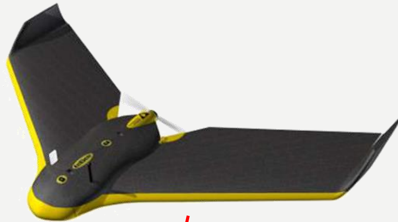
Bezpilotné lietadlo SenseFly eBee +