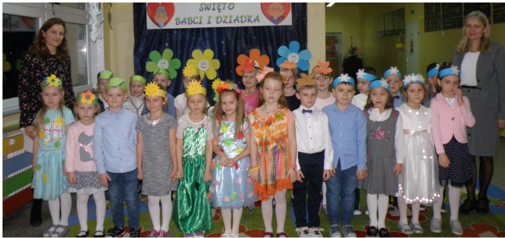
Dzień Babci i Dziadka świętowany w grupie 0a (opiekun p.M.Dopierała)