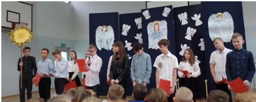
Jasełka 2018 w wykonaniu uczniów klasy VII C wraz z instrumentalistami (opiekun E.Piękoś)