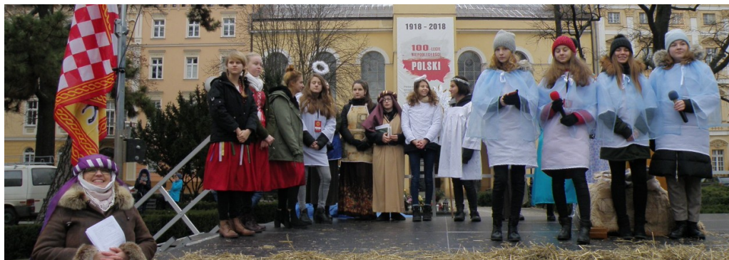
Orszak Trzech Króli (str.7)

W styczniu zakończyło się I półrocze roku szkolnego 2018/2019. Oceny zostały wystawione zgodnie z wewnątrzszkolnymi zasadami.