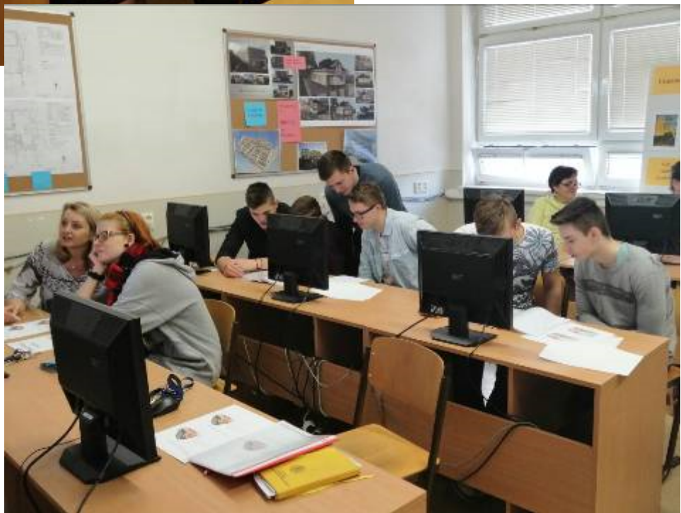
Obrázok 2 Práca počas hodiny