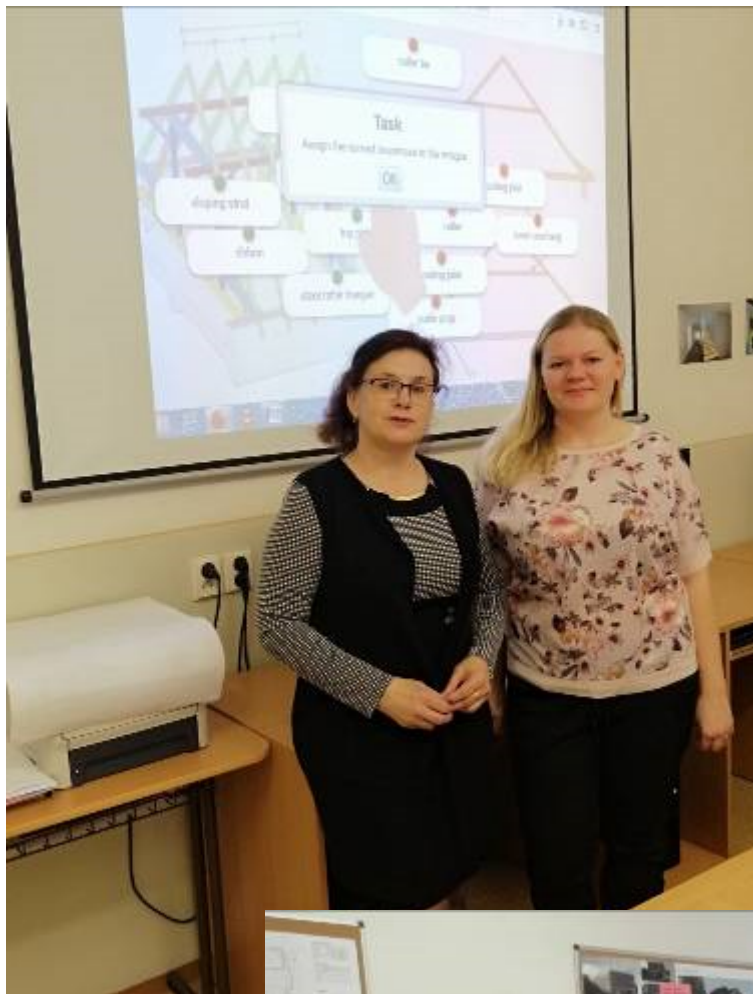
Obrázok 1 Organizátorky otvorenej hodiny