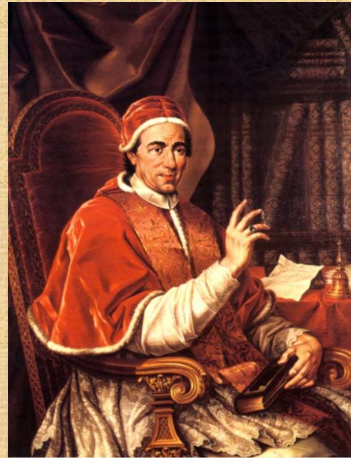
Papież Klemens XIV

System oświaty w Rzeczypospolitej wydawał się być oparty na solidnych podstawach. Jednak 21 lipca 1773 r. papież Klemens XIV rozwiązał zakon jezuitów, który prowadził aż 66 z 85 działających w ówczesnej Polsce szkół niższego i średniego szczebla. Krajowi groziła więc całkiem realnie edukacyjna katastrofa, bo nawet zakładając, że pozostałe szkoły – głównie pijarskie – po reformach Stanisława Konarskiego stały na bardzo wysokim poziomie, było ich po prostu za mało. Potrzebny był eksperyment.