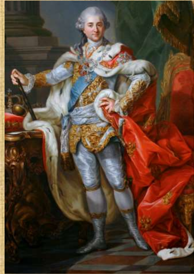
Stanisław August Poniatowski

Kiedy w 1764 r. stolnik litewski Stanisław Antoni Poniatowski wstępował pod imionami Stanisława Augusta na tron monarszy państwa polsko-litewskiego, szlachcic pragnący zapewnić synom wychowanie umożliwiające czynny udział w życiu politycznym Rzeczypospolitej miał do wyboru umieszczenie potomków albo w jednym z sieci równomiernie rozmieszczonych w całym kraju kolegiów prowadzonych przez zakon Jezuitów albo w jednej z mniej licznych szkół prowadzonych przez zakon Pijarów, z warszawskim Collegium Nobilium na czele. Wkrótce nowy król, realizując postulat pojawiający się wielokrotnie w paktach konwentach poprzedników, założył w Warszawie Szkołę Rycerską, kształcąca oficerów dla wojsk koronnych i litewskich.