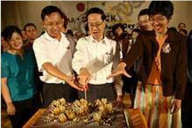
Dzień Nauczyciela w szkole w Singapurze

W jednych państwach ma on charakter oficjalny, w innych zwyczajowy. Dzień ten, podobnie jak w Polsce, związany jest z lokalnymi wydarzeniami.