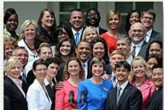
Spotkanie prezydenta USA Obamy z nauczycielami z okazji Dnia Nauczyciela, 2 maja 2011 roku