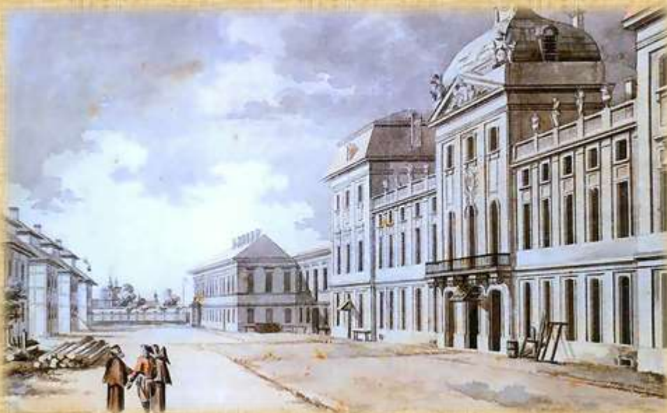
Szkoła Rycerska w Warszawie